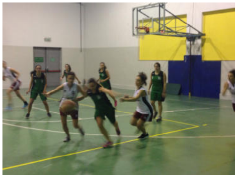
GOLGI - VALLA 36-5 (foto 1)

Golgi, campione dello scorso torneo, torna in campo con lo stesso spirito. Valla, sebbene ci metta tutta l'energia possibile, non entra in partita, lasciando spazio agli avversari, ben più preparati.