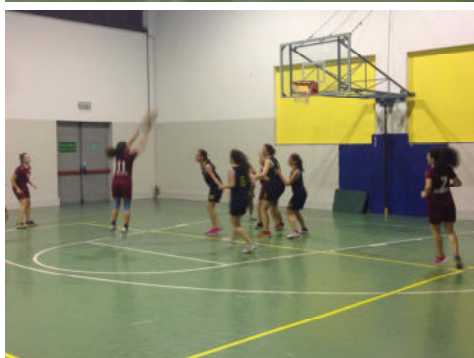
GRIZIOTTI - BORROMEO 22-16 (foto 2)

Golgi, campione dello scorso torneo, torna in campo con lo stesso spirito. Valla, sebbene ci metta tutta l'energia possibile, non entra in partita, lasciando spazio agli avversari, ben più preparati.