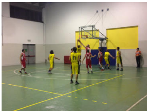
FRACCARO - S. CATERINA 35-32 (foto 1)

Esordio nel trofeo dei collegi per la squadra maschile del S. Caterina. Nonostante alla prima esperienza, mette giù una squadra agguerrita che riesce a dare del filo da torcere agli avversari. Fraccaro però ha dalla sua molta esperienza, non si lascia intimidire e conquista la vittoria.