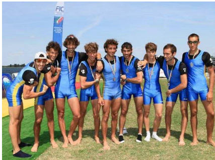
l'otto pesi leggeri

I canottieri del Cus Pavia conquistano un secondo posto con l'otto pesi leggeri ed un quarto posto con il singolo senior femminile ai campionati italiani di canottaggio.