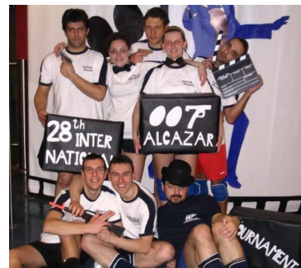
squadra "Cus Cus"

È sempre difficile rovistare tra i ricordi e descrivere emozioni e immagini per timore di non rendere merito a ciò che sentiamo vivido in noi, ma che le parole a volte stemperano; lo è ancora di più quando a quei momenti sono legate le situazioni che hanno creato nuove e profonde amicizie e che hanno consolidato un gruppo di persone che ha iniziato lo scorso ottobre il corso di volley organizzato dal CUS Pavia. Ragazzi che provengono da