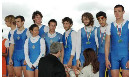
8 con sul podio

Ancora una volta l'otto con timoniere del CUS Pavia non ha deluso le aspettative, conquistando un oro ed un argento alla regata Internazionale svoltasi sabato 17 e domenica 18 aprile all'Idroscalo di Milano.