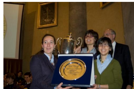
Premiazione Collegio Nuovo

Il Collegio Nuovo vince per la sesta volta consecutiva il Trofeo dei Collegi fra le ragazze, mentre fra i ragazzi è il Fraccaro ad imporsi per la quarta volta di fila.