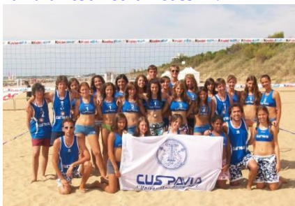
la comitiva cussina

La spedizione del CUS Pavia è rientrata dalla 7 giorni del Torneo internazionale "Beach & Ball" svoltasi a Lignano Sabbiadoro dal 28 giugno al 5 luglio ottenendo buoni piazzamenti e non senza qualche piacevole sorpresa. All'ormai consueto appuntamento la comitiva cussina si è presentata con 25 atleti (20 femmine e 5 maschi) suddivisi in 8 squadre: 3 under 14, 2 under 16, 3 under 18 nel femminile; mentre nel maschile una sola squadra di under 16 ha difeso i colori cussini.