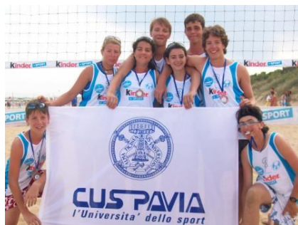
under 16 maschile e femminile