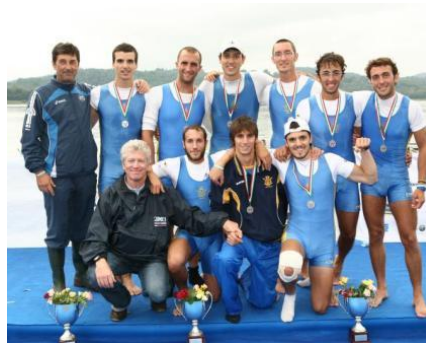
l'otto fuori scalmo è secondo sul podio

passaggio degli ultimi 250 metri i nostri atleti erano al secondo posto, ma in acqua 1 c'era la forestale (equipaggio composto da atleti campioni del mondo pesi leggeri e anche da riserve olimpiche) che incalzava cercando di recuperare il distacco accumulato con la partenza bruciante dei pavesi.