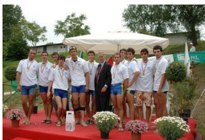
I canottieri del Cus Pavia sul podio

Terminate le gare, aggiornato il medagliere, è ora possibile formulare i primi bilanci dei campionati. Il Cus Pavia si colloca ancora una volta al vertice della classifica dei centri sportivi universitari italiani. Con 12 medaglie d'oro il Cus Pavia si classifica al quinto posto su 49 Cus partecipanti.