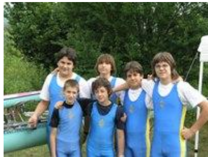
le giovani promesse

Buoni risultati dal lago di san miniato dove sono scesi in acqua le giovani promesse gialloblu, due equipaggi cadetti e un equipaggio di categoria allievi C.