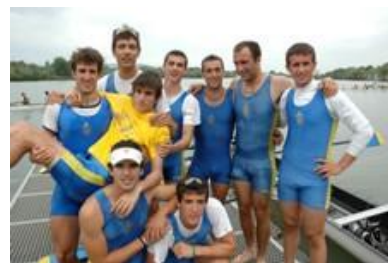
Gli atleti dell'08+