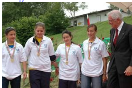
K4 femminile sul podio

Senza dubbio questa edizione verrà ricordata per la vittoria del K4 femminile pavese: il nostro equipaggio si è aggiudicato la gara con una strategia ineccepibile, lasciando indietro le avversarie del CUS Bari già in partenza, per poi controllarle per tutto il resto del percorso. Sin qui nulla da contestare, se poi consideriamo anche che le 4 ragazze sono tutte studentesse del College Remiero di Pavia.