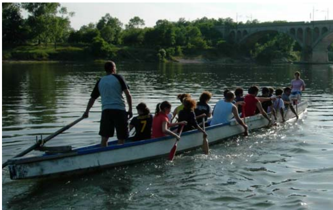
Dragon Boat in allenamento

Venerdì 1 giugno dalle ore 16,00, sul tratto di fiume di circa 300 metri fra il Lido e il Ponte della Ferrovia, si terranno le gare eliminatorie da cui verranno selezionati i 2 equipaggi che si affronteranno nella finale di sabato.