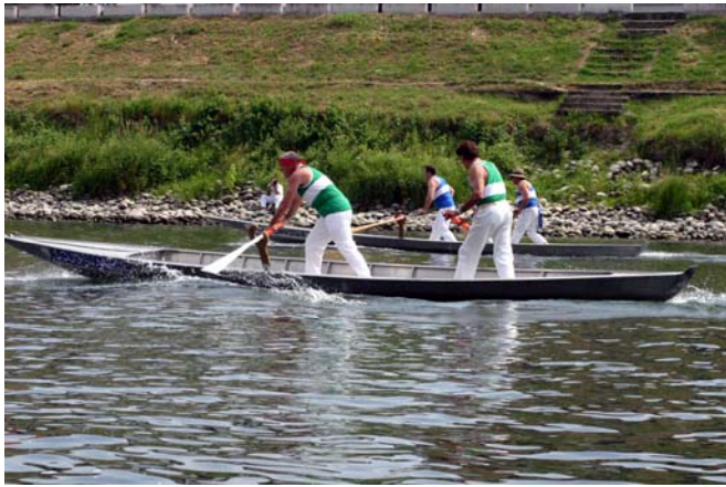
Gara di Barcé

Nel programma della XLV edizione della Regata Universitaria Pavia - Pisa è stata introdotta una gara di dragon boat tra i Collegi Universitari. Ciascun equipaggio sarà composto da 18 vogatori (12 maschi e 6 femmine) da un tamburino e da un timoniere fornito dal CUS. Per questo è stata data la possibilità ai collegi solo maschili e solo femminili di fondersi a formare un unico equipaggio.