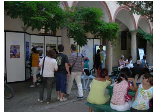
Porte Aperte stand informativi CUS Pavia

Mercoledì 18 Luglio, presso il Palazzo Centrale dell'Università di Pavia, più di mille studenti hanno curiosato e popolato "Porte Aperte" , l'evento che rappresenta il punto d'arrivo di un programma diversificato di orientamento alla scelta, promosso dal C.O.R., con lo scopo di raggiungere tutti i soggetti coinvolti nel processo decisionale: studenti, genitori, laureandi, docenti delle scuole superiori. Ma anche gli studenti universitari che stanno ultimando la laurea di primo livello. Una parte importante della vita universitaria è legata anche alle attività sportive, attraverso il CUS Pavia , che offre e organizza attività sportiva che vanno dalla pratica agonistica ai più alti livelli (canottaggio, canoa, atletica, scherma, rugby, tiro con l'arco), ai corsi propedeutici per coloro che desiderano avvicinarsi allo Sport.