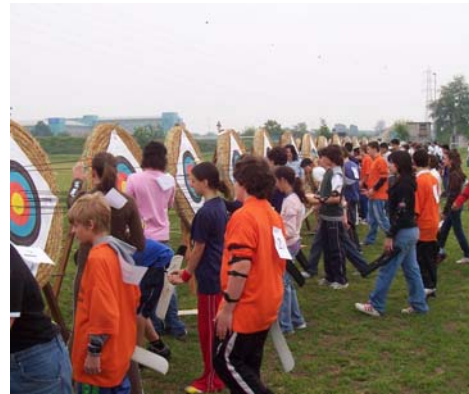
Gara scolastica 6 maggio al Cravino