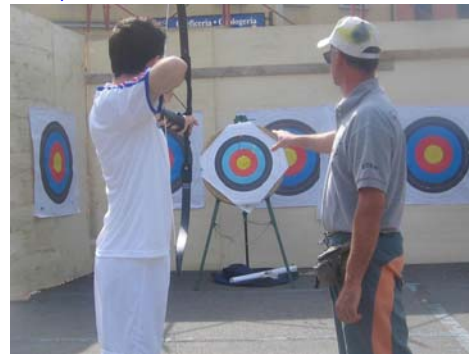
"Stradella in Sport"

qualificati per le finali dei Giochi della Gioventù (fase regionale) che si terrà a Vigevano domenica 28 maggio. La sezione arco, con le sezioni scherma ed atletica