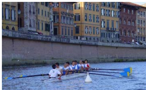
I CANOTTIERI PAVESI SULL'ARNO

Domenica 7 Maggio alle ore 19.00 a Pisa sul fiume Arno si svolgerà la XLIV edizione della tradizionale regata fra le Università di Pavia e Pisa.