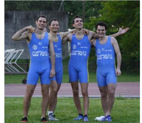
GLI ATLETI DELLA 4X100

Il quartetto, ormai collaudato dopo due anni di competizioni ad alto livello, ha centrato l'obiettivo della stagione alla prima uscita, nonostante un notevole ritardo nello scendere in pista che ha disturbato il loro riscaldamento e le condizioni atmosferiche diventate non certo ideali per la velocità.