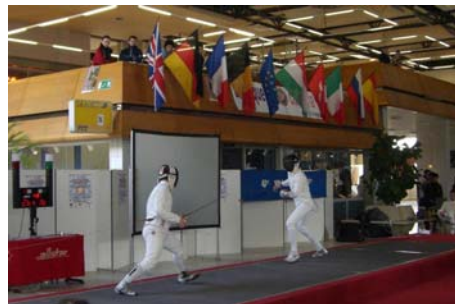
"UN MOMENTO DELLA GARA"

giovedì e sabato la disputa di una competizione individuale femminile e di una a squadre maschile per ciascuna delle tre armi (fioretto, spada, sciabola), con sei classifiche separate, una per ogni gara, e una classifica complessiva per l'assegnazione del prestigioso Challenge. Agli schermatori del CUS è bastata l'imponente forza di altissima qualità messa in campo in una sola delle tre armi, la spada, per avere ragione degli avversari provenienti da tutta Europa e anche dal Nordamerica: pur avendo il rammarico di non avere conquistato il primo posto in nessuna delle due competizioni riservate all'arma