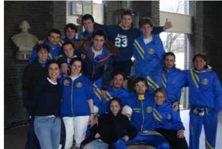
GLI SCHERMIDORI A PARIGI

Splendido successo del CUS Pavia, a Parigi, nel XIV Challenge di Scherma dell'Ecole Polytechnique, vero e proprio Campionato Europeo di scherma per squadre universitarie, che ha visto tra